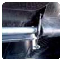
Amortiguador a gas en pedal